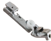
Pie SA212 elástico