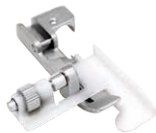
Pie SA211 perlas