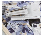
Pie SA225CV cubierta de doble pliegue