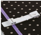
Pie SA222CV biés para plegar y unir cintas de 12 mm