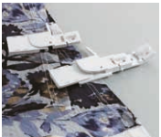
Pie SA221CV set de dobladillo