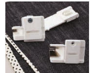
Pie SA230CV set de cintas al biés invisible