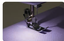
Zona de trabajo bien iluminado con indicadores LED